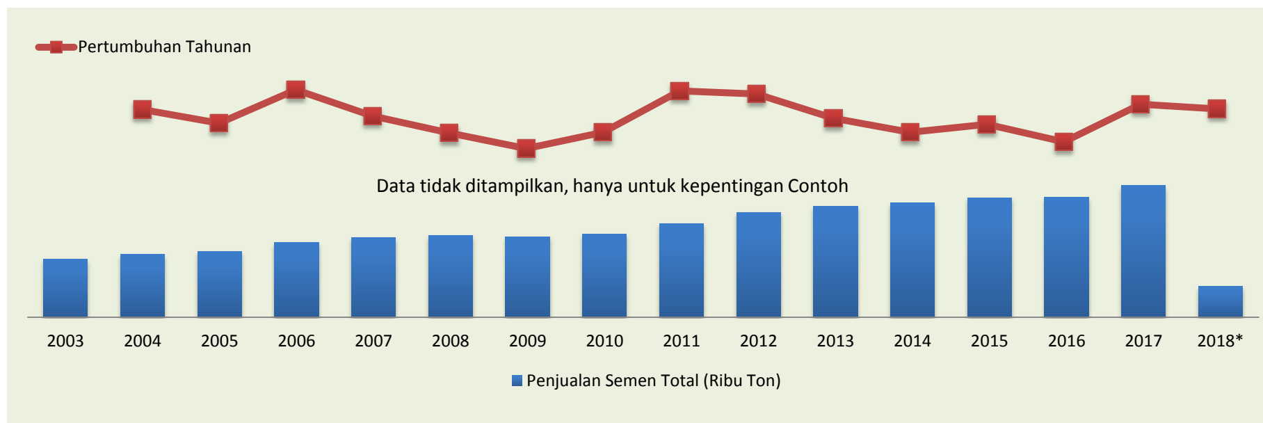
Grafik 2.3. Penjualan Semen Total (Dalam Negeri dan Ekspor), 2003 - 2018

Sumber: IndoAnalysis Research, diolah dari Asosiasi Semen Indonesia (ASI)