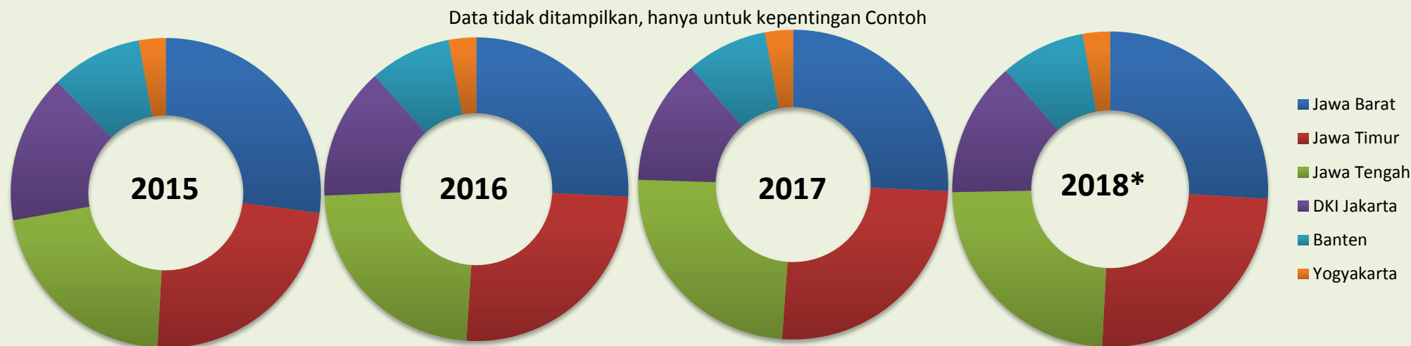
Grafik 2.13. Komposisi Konsumsi Semen di Pula Jawa Berdasarkan Propinsi, 2015 – 2018

Sumber: IndoAnalysis Research, diolah dari Asosiasi Semen Indonesia (ASI)